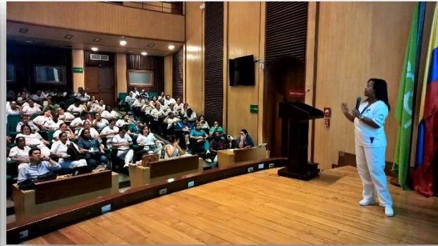
4ª Jornada Nacional de Vacunación (sábado 29 de octubre)

Acto inaugural de Jornada en Llano Verde – Oriente de Cali