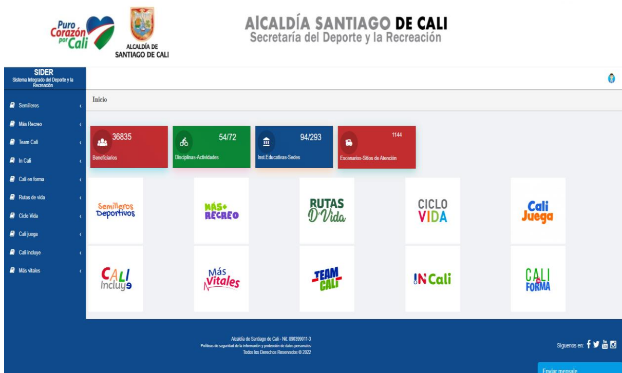
Gráfica 1. Interfaz de inicio del aplicativo SIDER